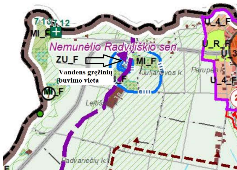
1 pav. Ištrauka iš Biržų rajono bendrojo plano.

Teritorijoje parengtas Biržų rajono bendrasis planas, teritorija patenka į žemės ūkio teritorijų zonas. Biržų rajono bendrajame plane numatytos požeminio vandens vandenviečių apsaugos zonos.