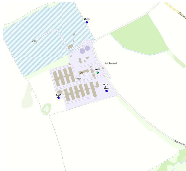
2 pav. Ištrauka iš Tarnybos žemėlapis.

Požeminio vandens gręžiniai registruoti Lietuvos geologijos tarnyboje prie Aplinkos ministerijos (toliau - Tarnyba)