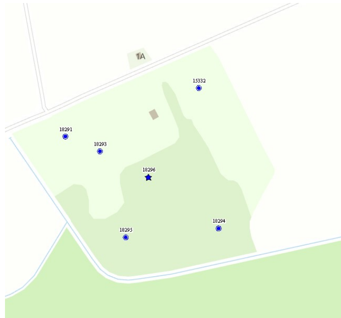
2 pav. Ištrauka iš Tarnybos žemėlapis.

Požeminio vandens gręžiniai registruoti Lietuvos geologijos tarnyboje prie Aplinkos ministerijos (toliau - Tarnyba).